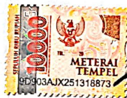
Ahmad Riza Pahlevi