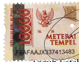
Teguh Fatchur Rozi