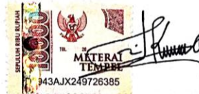
Imaniati Khidmatul Jannah

Tuluangung, 25 Juni 2021 Yang membuat pernyataan,