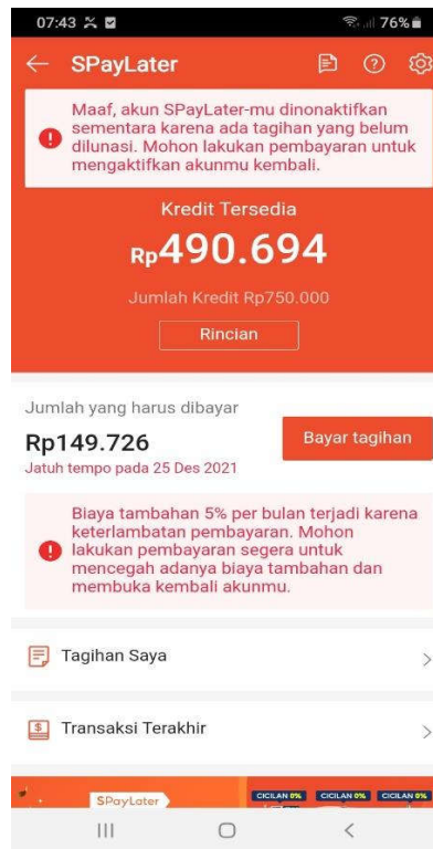
(gambar 3. Screenshot aplikasi Shopee Paylater )

d. Dilaksanakannya penagihan lapangan. 47