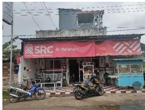
Banner mitra SRC.