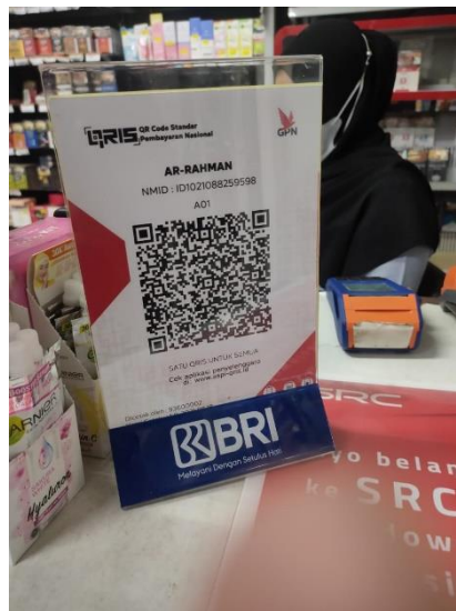
QRIS yang terdapat ditoko Ar-Rahman