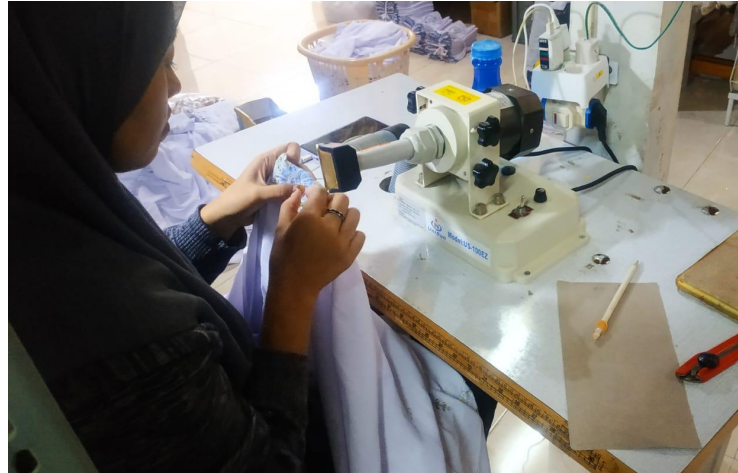
Gambar 4.3 Proses Kontrol Produksi

Begitupun pemaparan dari Mbak Nanik selaku asisten pada industri pakaian jadi Lely Indah Konveksi dan Bordir Komputer Blitar.