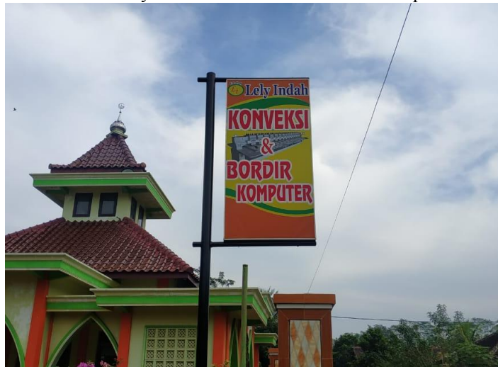
Gambar 4.1 Tulisan Lely Indah Konveksi dan Bordir Komputer

Berdasarkan kegiatan observasi yang dilakukan dapat diketahui bahwa industri pakaian jadi Lely Indah Konveksi dan Bordir Komputer ini terletak di di Jln. Srigati RT 1 RW 7 Desa Siraman, Kecamatan Kesamben, Kabupaten Blitar. Industri konveksi ini telah memproduksi beraneka jenis pakaian muslim baik pria maupun wanita, serta melayani berbagai macam pesanan pelanggan. Dengan dibantu 43 karyawannya,