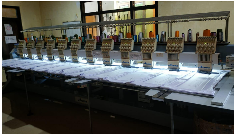
Mesin Bordir Komputer