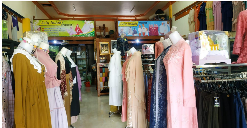
Display Toko Lely Indah Collection