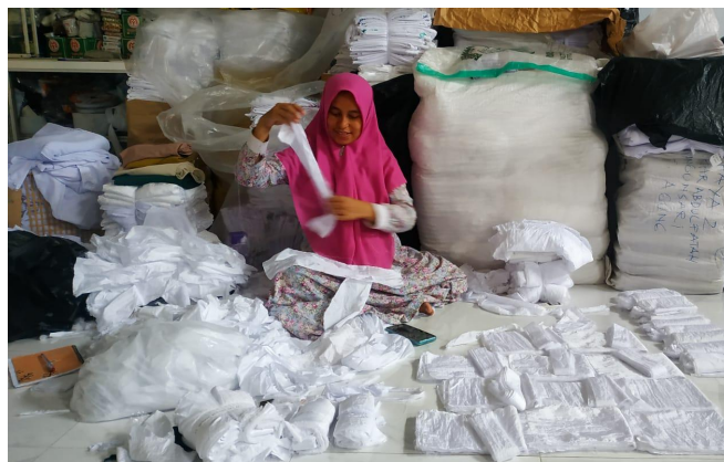
Proses Pemotongan Kain