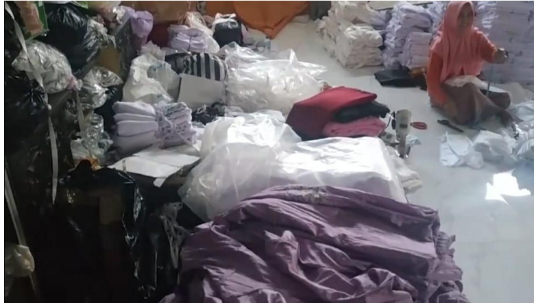
Gambar 4.7 Persediaan Bahan Baku

Dengan adanya strategi persediaan akan membantu perusahaan dalam memperkirakan banyaknya bahan baku yang diperlukan dalam sebuah produksi pada kurun waktu teretntu. Selain itu juga dapat mengetahui daya beli konsumen dengan mengetahui jumlah persediaan yang tersedia. Melalui kegiatan observasi dapat diketahui bahwa pada industri pakaian jadi Lely Indah Konveksi dan Bordir Komputer Blitar strategi persediaan sudah diterapkan dalam memperkirakan ketersediaan bahan baku serta stok produk yang siap dijual. Dimana penyetokan persediaan bahan baku dilakukan mulai 6 bulan sebelum hari raya.