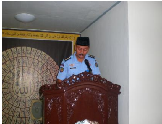
Dokumentasi Kalapas Ketika Memberikan Ceramah Setelah Sholat Dzuhur Berjama'ah tanggal 11 juni 2015 Pukul 12.30 WIB di Masjid Lapas Tulungagung