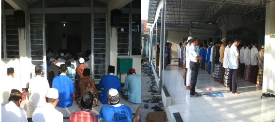
Dokumentasi Kegiatan Sholat Dzuhur Berjama'ah tanggal 11 juni 2015 Pukul 12.00 WIB di Masjid Lapas Tulungagung