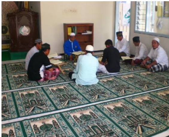
Dokumentasi Kegiatan Pembelajaran Agama Islam Narapidana dengan Ustadz di Masjid Lapas Tulungagung tanggal 15 Juni 2015 pukul 08.00 WIB