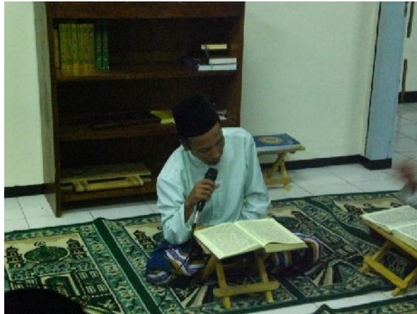
Dokumentasi Kegiatan Tadarusan di Masjid Lepas Tulungagung tanggal 16 Juni 2015 pukul 09.30 WIB