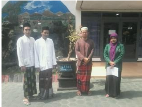
Dokumentasi Foto Bersama Peneliti dengan Narapidana di Lapas Tulungagung tanggal 15 Juni 2015 pukul 10.00 WIB