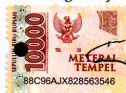
Fina Dwi Sastafiana Namaterangdantandatangani

Tulungagung, 11 Juni 2022 Yang Menyatakan,