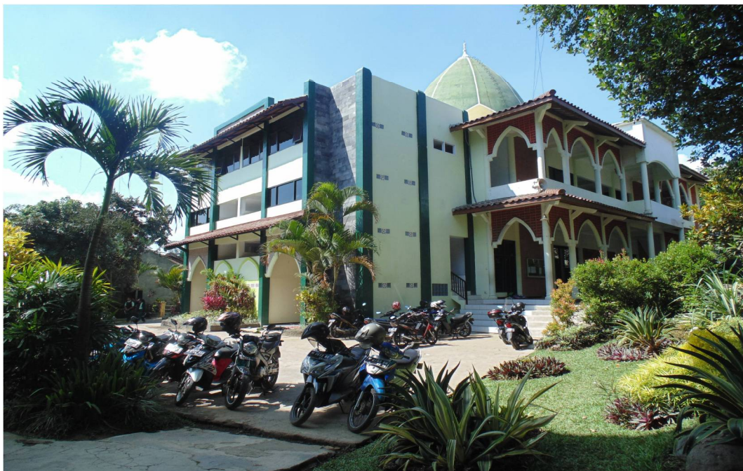
Masjid SMP IBS Ar-Rohmah Malang