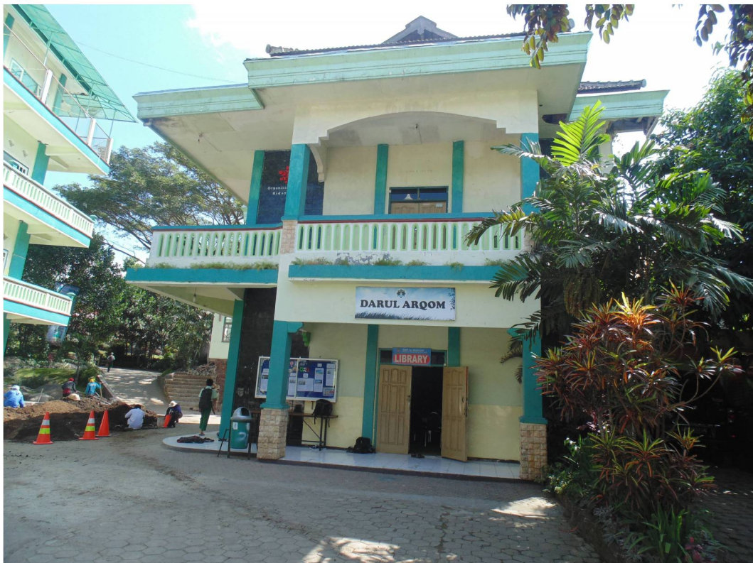
Gedung Darul Arqom dan Perpustakaan SMP IBS Ar-Rohmah Malang