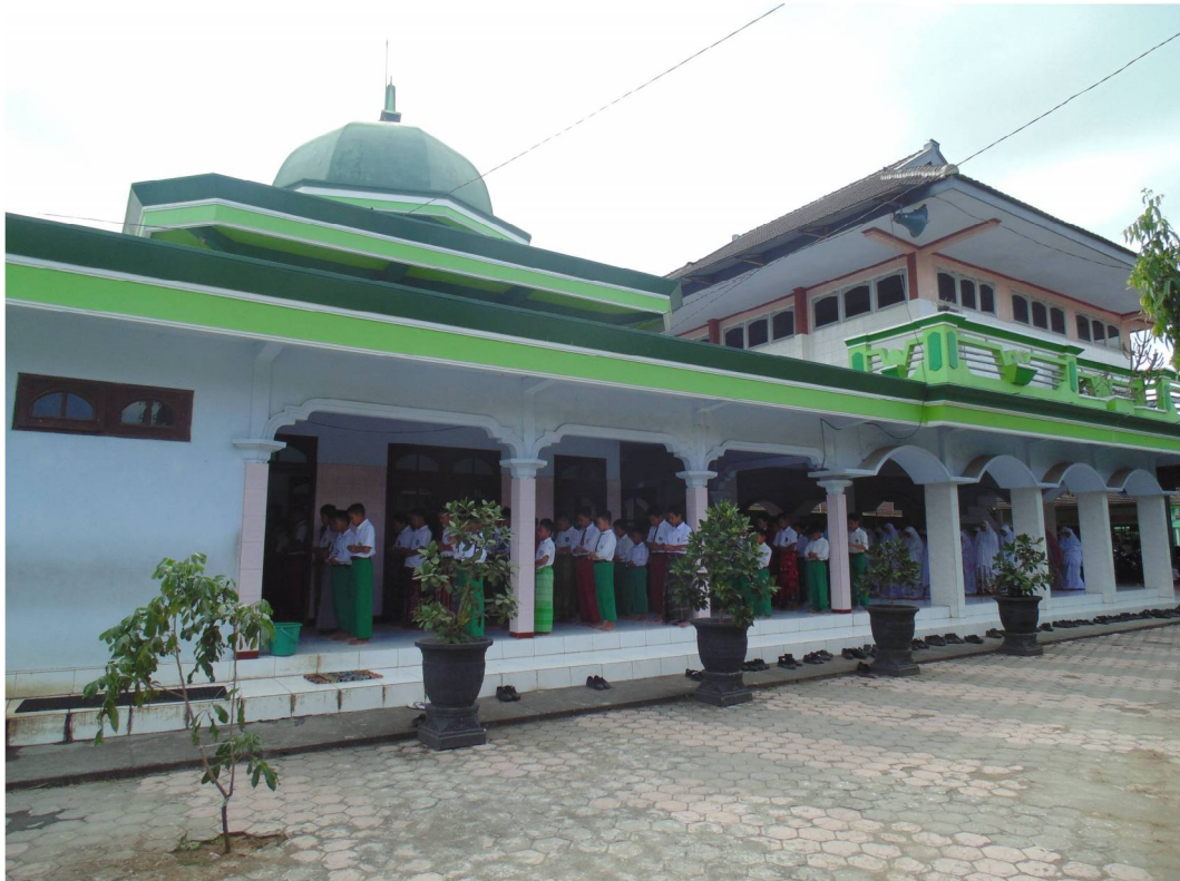
Masjid Al Mukhlisun MTsN Kunir