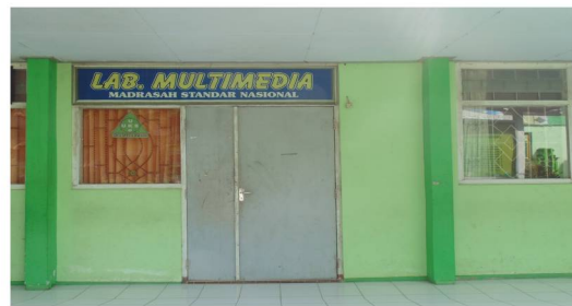
Laboratorium MTsN Kunir