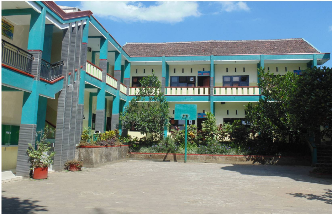
Gedung Sekolah SMP IBS Ar-Rohmah Malang