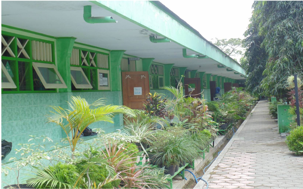
Ruang kelas MTsN Kunir