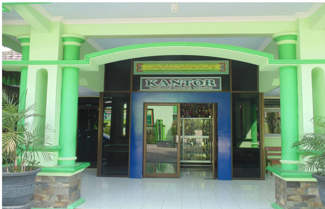
Kantor MTsN Kunir