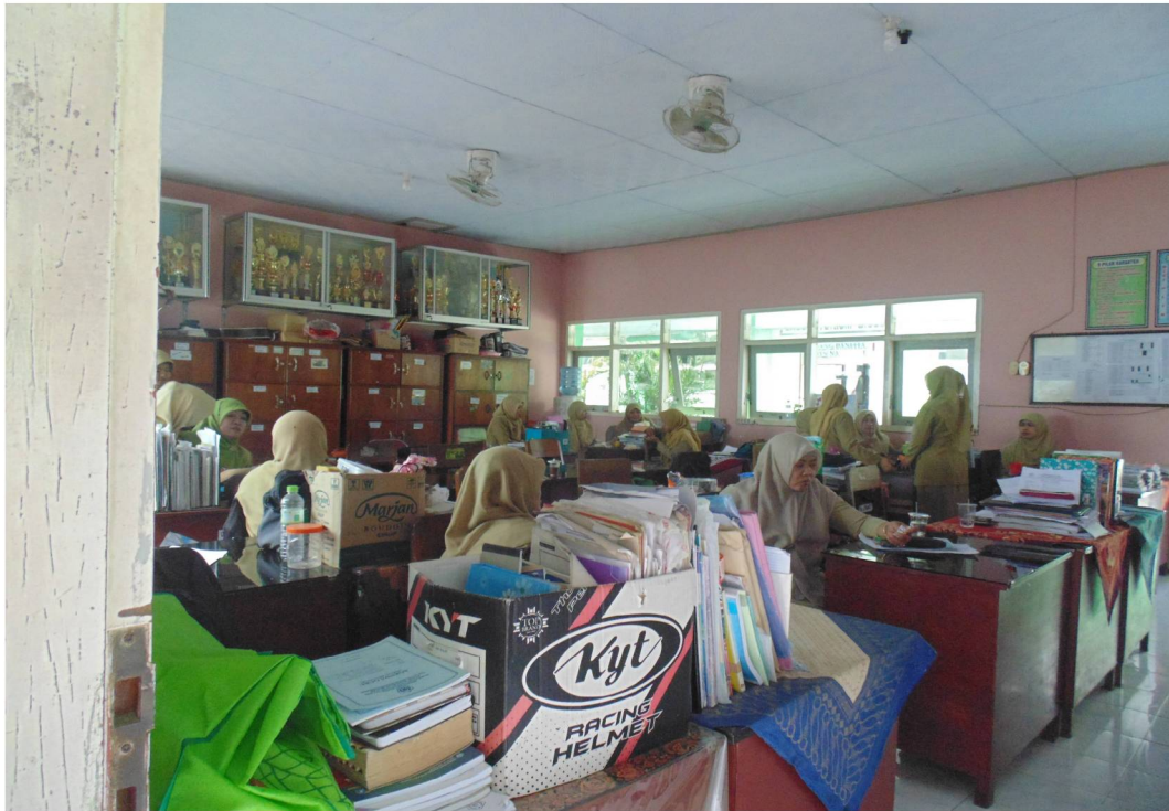
Ruang Guru MTsN Kunir