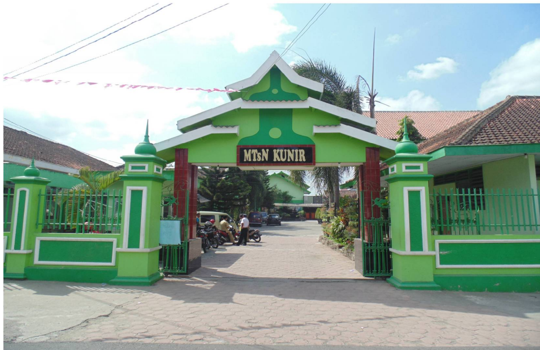
Gerbang Masuk MTsN Kunir Blitar