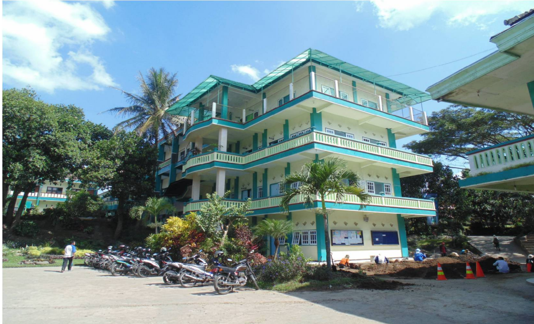
Kantor SMP IBS Ar-Rohmah Malang