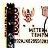
Siti Nurlailil Fauziah