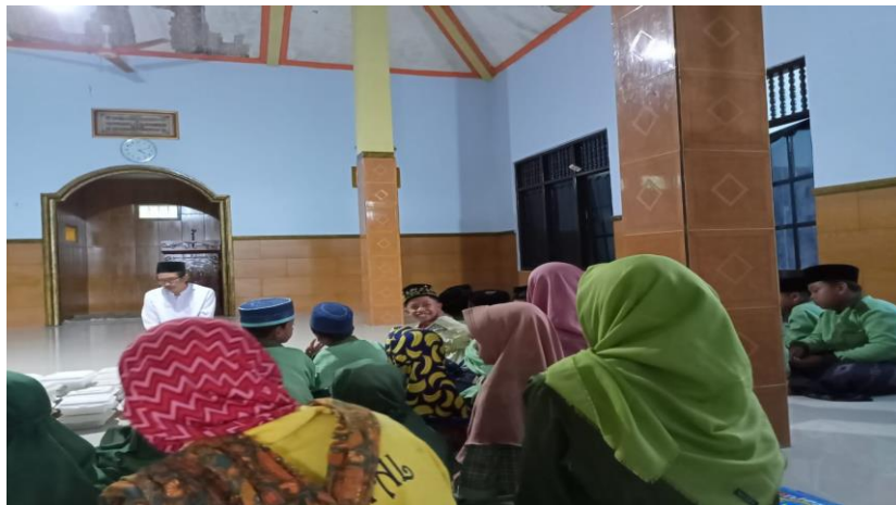
Dokumentasi kegiatan doa bersama isra' mi'raj