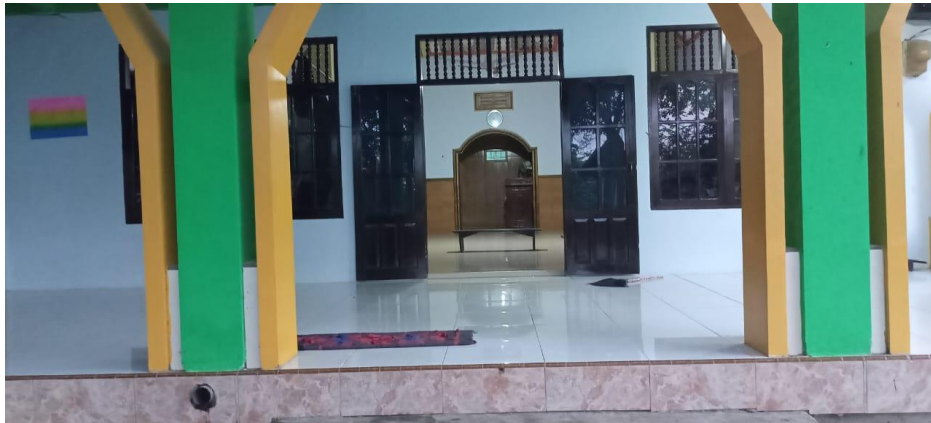
Dokumentasi tempat pembelajaran TPQ Al-baiturrohim