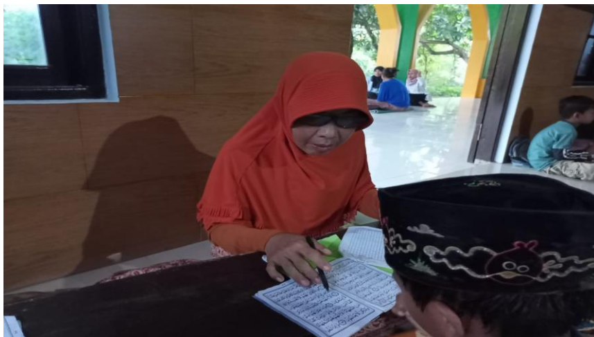
Dokumentasi pelaksanaan pembelajaran di TPQ Al-baiturrohim