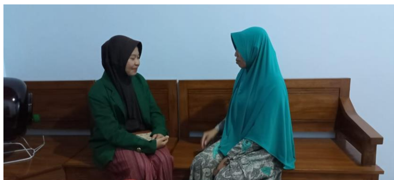
Dokumentasi wawancara dengan Guru TPQ Al-baiturrohim