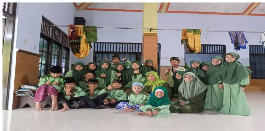
Dokumetasi para santri di TPQ Al-baiturrohim