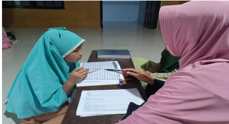
Dokumentasi pelaksanaan pembelajaran di TPQ Al-baiturrohim