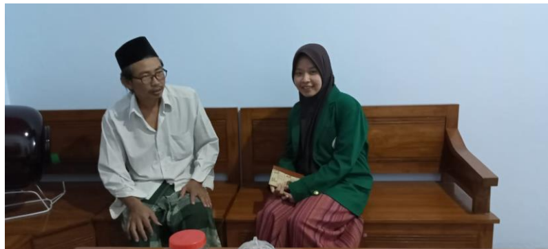
Dokumentasi wawancara dengan Kepala TPQ Al-baiturrohim