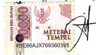
Dimas Asif Natory