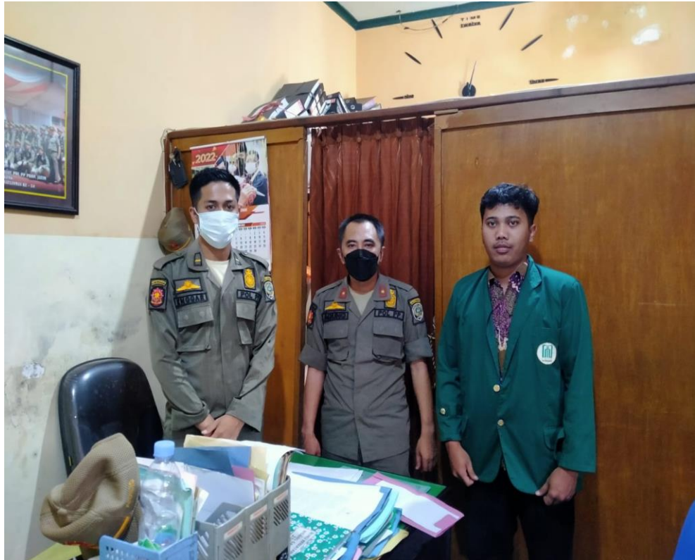
2. Dokumentasi Surat Keterangan Penelitian Dari Satpol PP Kabupaten Tulungagung