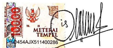
Ois Hifsoh Nadhiroh