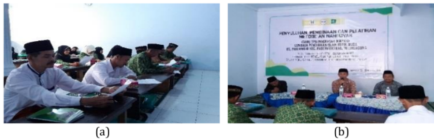
Gambar 1. Kegiatan pendampingan (a) Suasana Pelatihan (b) Kegiatan penyuluhan

Pedoman pengajaran TPQ Metode An-Nahdliyah melalui ketentuan Umum dan Ciri-ciri Khusus metode An-Nahdliyah untuk pengelolaan pengajaran santri dikatakan tamat belajar apabila telah menyelesaikan dua program yang dicanangkan, yaitu: 1) Program Buku Paket (PBP), program awal yang dipandu dengan buku Cepat Tanggap belajar Al-Quran An-Nahdliyah sebanyak enam jilid yang dapat ditempuh kurang lebih enam bulan. 2) Program Sorogan Al-Quran (PSQ), yaitu program lanjutan sebagai aplikasi praktis untuk menghantar santri mampu membaca Al-Quran sampai khatam 30 juz. Pada program ini santri dibekali dengan sistem bacaan gharaibul Quran dan lainnya. Untuk menyelesaikan program ini diperlukan waktu kurang lebih 24 jam. Adapun ciri khusus metode ini adalah: Materi pelajaran disusun secara berjenjang dalam buku paket 6 jilid; Pengenalan huruf sekaligus diawali dengan latihan dan pemantapan makharijul huruf dan sifatul huruf; Penerapan qaidah tajwid dilaksanakan secara praktis dan dipandu dengan titian murattal; Santri lebih dituntut memiliki pengertian yang dipandu dengan asa CBSA melalui pendekatan keterampilan proses; Kegiatan belajar mengajar dilaksanakan secara klasikal untuk tutorial dengan materi yang sama agar terjadi proses musafahah; Evaluasi dilaksanakan secara kontinu dan berkelanjutan. Kemudian metode yang dipakai dalam proses belajar mengajar di TPQ An-Nahdliyah adalah: Metode demonstrasi; Metode drill, Tanya jawab, Metode ceramah.