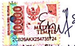
(Eka Fitriya Wulan Madjid)

Tulungagung, 30 Januari 2023 Yang Menyatakan,