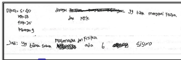
Gambar 4. Jawaban S 2 pada Soal Nomor 2

Berdasarkan Gambar 3, dalam menjawab soal nomor 1 S 2 menuliskan apa yang diketahui terlebih dahulu. Kemudian S 2 menggambarkan diagram venn dengan lingkaran kiri yaitu pangkat pinang 14 anggota, lingkaran kiri 12 anggota, bagian lingkaran yang berpotongan x anggota, dan diluar lingkaran 7. Kemudian ia membuat persamaan S = PP + TT + TM , namun pada saat substitusi nilai ia memunculkan variabel x, yaitu 30 = 14 + 12 + x + 7 . S 2 mengoperasikan dengan tepat, sehingga mendapat jawaban akhir yang tepat pula yaitu 3. S 2 juga membuat kesimpulan bahwa ada 3 orang yang mengikuti kedua lomba.