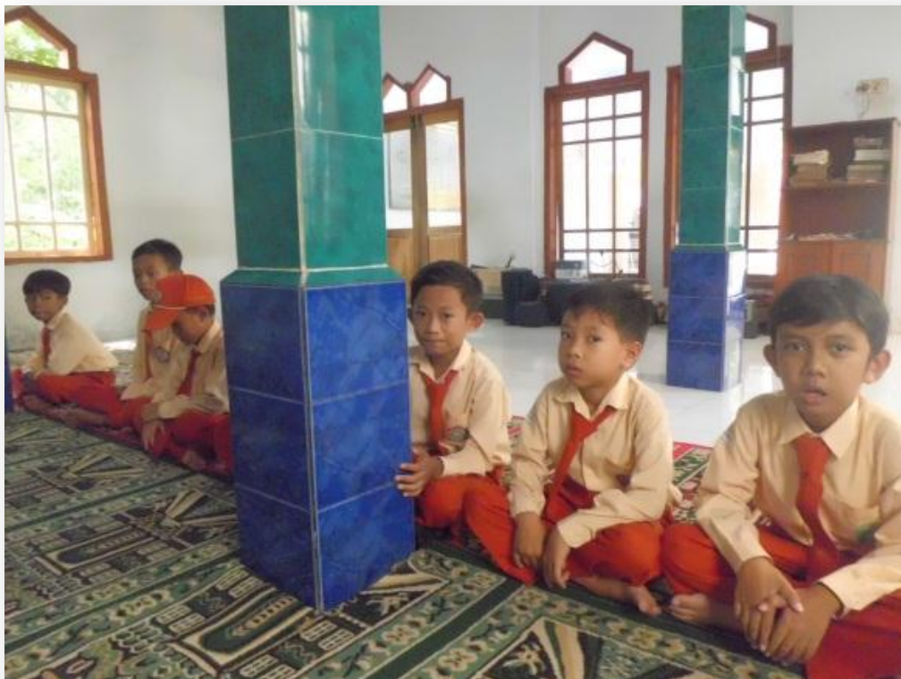
Dokumen gambar 2.4 Antusias peserta didik MI Sugihan