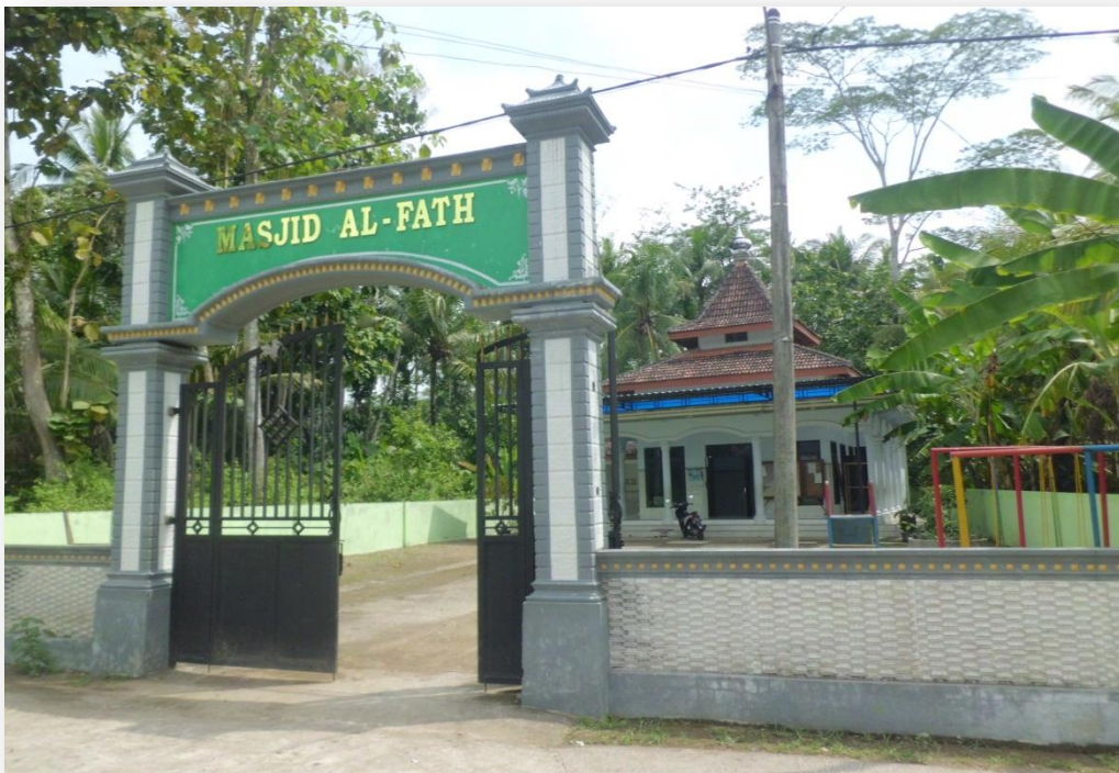
Dokumen gambar 1.2 Masjid Al Fath MI Senden