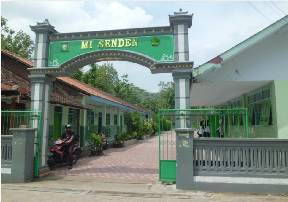
Dokumen gambar 1.1 Gedung MI Senden tampak dari pintu gerbang