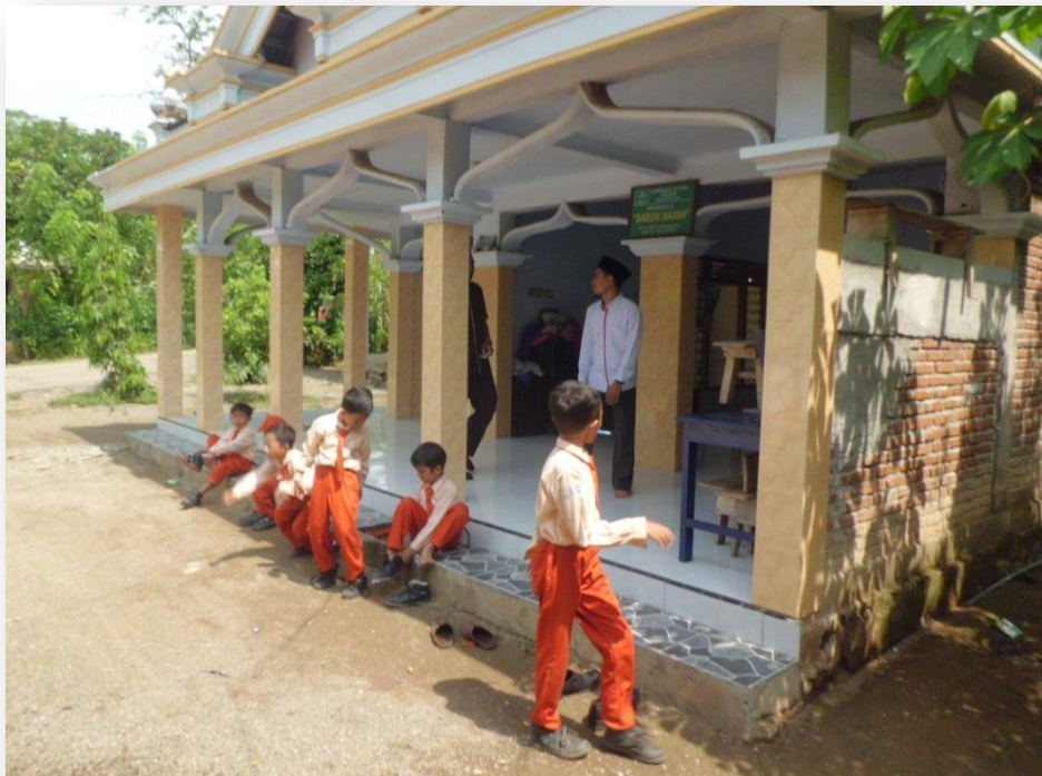
Dokumen gambar 2.2 Mushalla Darun Najah MI Sugihan