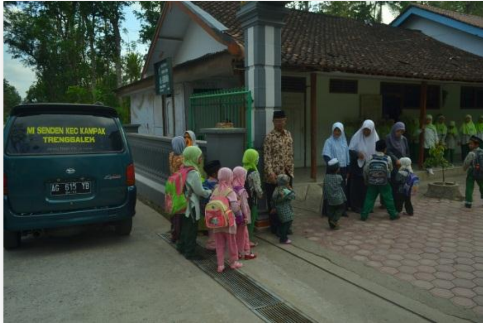
Dokumen gambar 1.7 Kepala dan Guru MI Senden menyambut kedatangan peserta didiknya