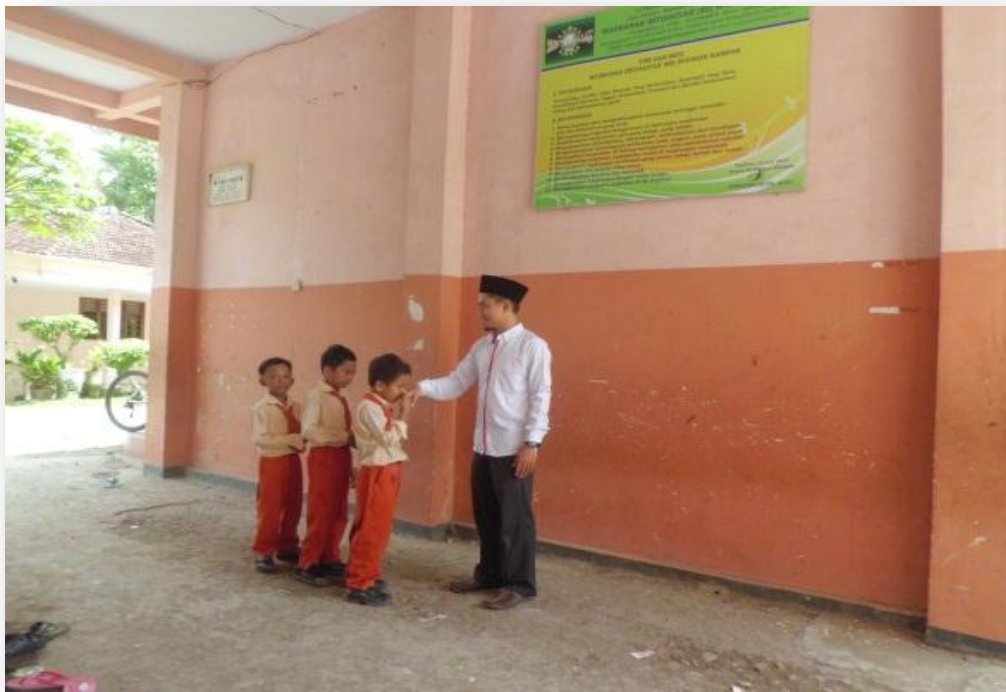
Gambar 2.6 Good morning student bersama Kepala MI Ssugihan