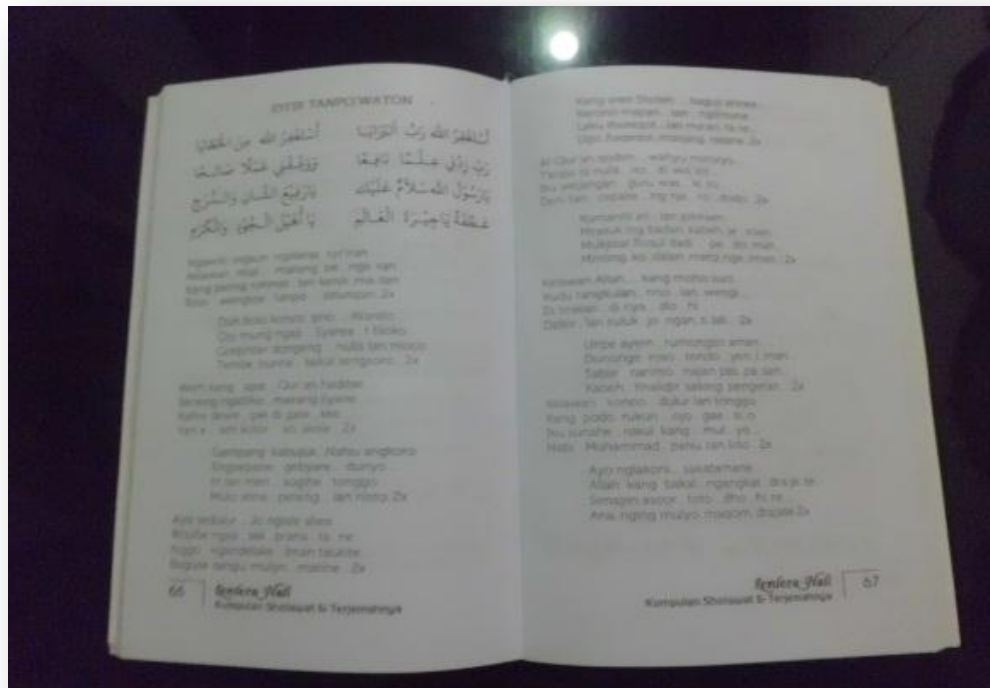
Gambar 1.5 Syair Nasihat Tanpa Waton