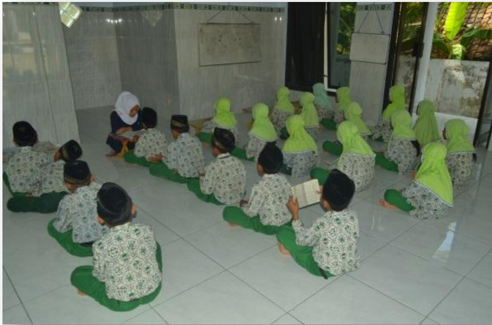
Dokumen Gambar 1.4 Antusiasme peserta didik