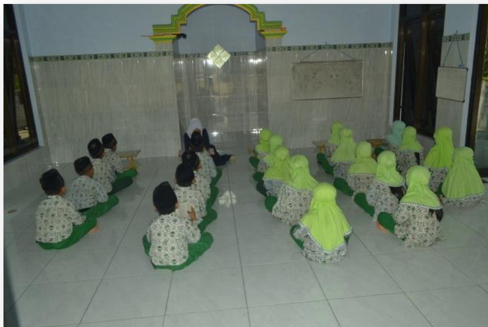
Dokumen gambar 1.6 Antusias peserta didik mengikuti pujian