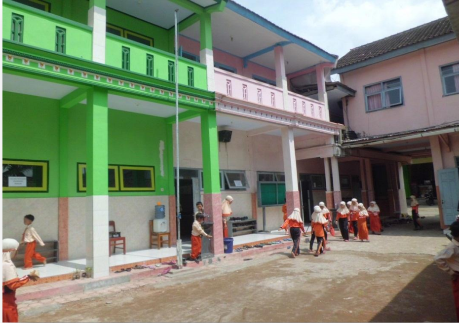
Dokumen gambar 2.1 Gedung MI Sugihan, Kecamatan Kampak