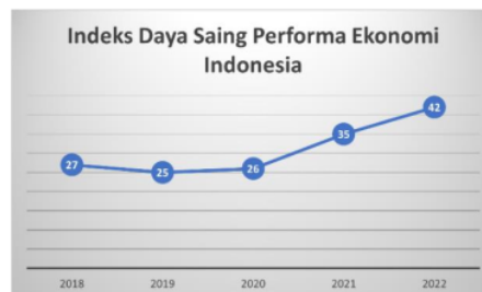
Tabel 1. Indeks Daya Saing Performa Ekonomi Indonesia

Sumber : Institute for Management Development (IMD) World Competitive Year book 2022 .