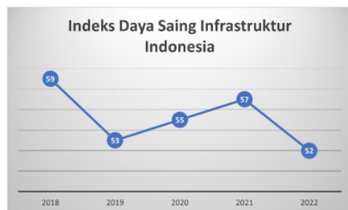
Tabel 5 Indeks Daya Saing Infrastruktur Indonesia