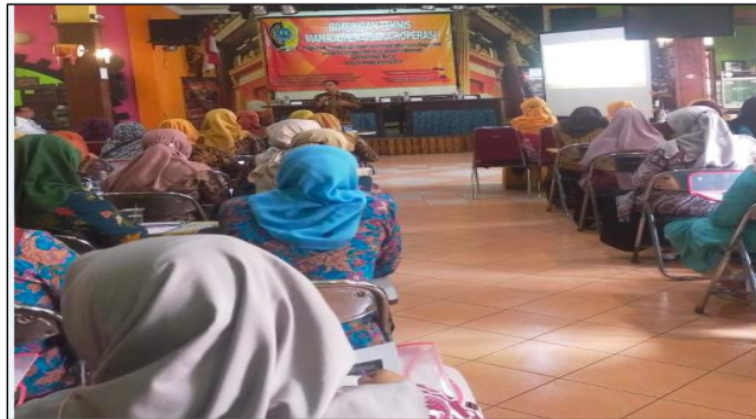
Gambar 1. Penyampaian Materi

Materi manajemen keuangan terkait dengan pelaporan keuangan yang terdiri dari neraca dan laporan laba rugi. Neraca merupakan aktivitas pencatatan harta kekayaan dan kewajiban perusahaan, sedangkan laporan laba rugi menyajikan rincian penjualan dan biaya operasional perusahaan untuk memperoleh keuntungan. Manajemen sumber daya manusia koperasi terkait dengan anggota yang ditingkatkan baik jumlah maupun partisipasinya dalam koperasi untuk meningkatkan jumlah penjualan dan SHU koperasi dan anggota koperasi. Dokumentasi penyampaian materi sebagaimana pada Gambar 1.