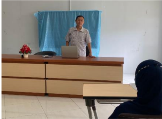
Gambar 3. Sesi Pelatihan

memecahkan persoalan-persoalan yang muncul pada saat bisnis dijalankan. Ketiga materi ini terangkum dalam penyusunan perencanaan bisnis ( business plan ).