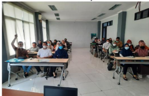
Gambar 4. Sesi Tanya Jawab

Pada sesi pelaksanaan pelatihan, peserta berpartisipasi aktif yang ditunjukkan oleh interaksi dalam melakukan tanya jawab sebagaimana pada gambar 4. Interaksi yang dilakukan oleh para peserta terkait dengan perencanaan bisnis sebelum kegiatan usaha dimulai. Kemudian pemateri memberikan argumentasi dalam kaitannya dengan perencanaan bisnis, bahwa business plan memang menjadi sesuatu yang sangat penting di awal kegiatan bisnis. Namun demikian, pada umumnya seorang wirausahawan muda dan pada skala kecil tidaklah wajib memiliki rencana bisnis yang terdokumentasi.