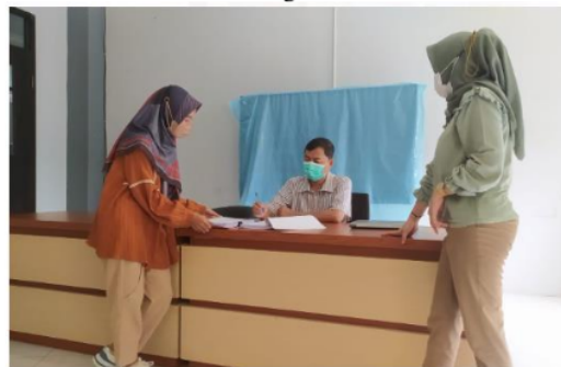
Gambar 2. Registrasi Peserta

Pertama, pada saat registrasi. Sebanyak 40 orang peserta hadir dalam pelatihan ini sehingga jika dipersentase sebanyak 100% peserta hadir. Kehadiran peserta ini menunjukkan antusiasme mahasiswa Program Studi Magister Ekonomi Syariah untuk mengikuti pelatihan ini sebagaimana pada dokumentasi atau gambar 2.