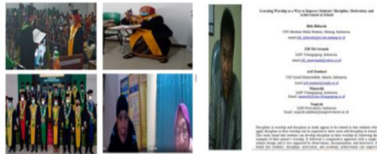
Gambar 1. Foto terkait hasil ekspresi mencapai target

muhsininnya seseorang, tidak ada keirian dan kedengian di dalamnya. Ihlas memberikan bantuan dan mendukung sesama, begitulah kiyai pejabat ini. Hanya doa yang bisa penulis panjatkan untuk membalas kebaikan kiyai pejabat ini..... semoga mendapat tempat terbaik disisi Allah. Membantu melayani berjuang tanpa harap berbalas apa-apa. Keihlasan kiyai pejabat ini insya Allah melancarkan jalan menuju rahmat Allah hingga kemudahan mendapatkan surga. Allhohuma aamien.