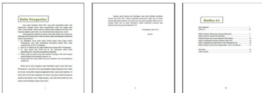
Gambar 4.3 Tampilan Bagian Awal Bahan Ajar Kelas VIII