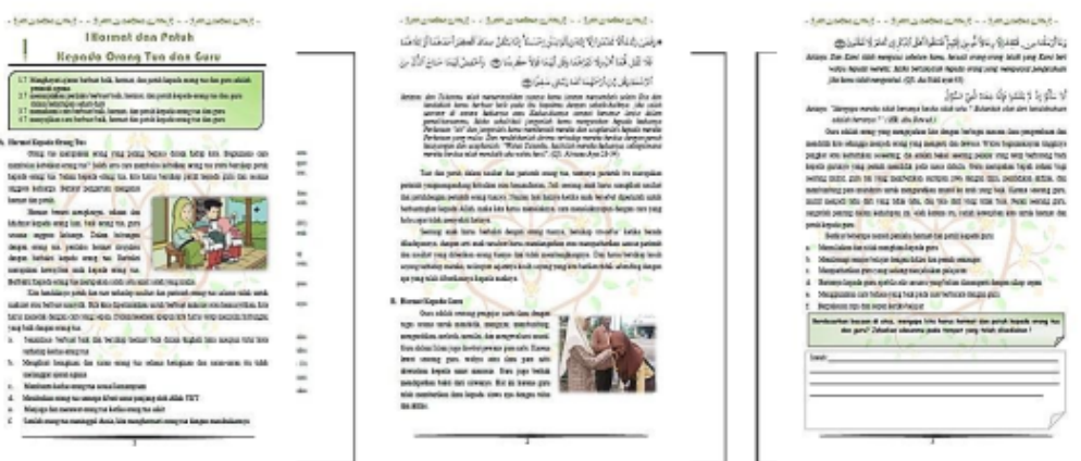
Gambar 4.4 Tampilan Bagian isi produk

Bagian isi terdiri dari pengantar pembelajaran, penulisan dan pemahaman soal, dan prosedur respon siswa. Bagian isi buku guru terdiri dari pemetaan keterampilan dasar,