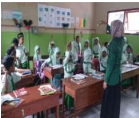
Peneliti menggali keaktifan peserta didik