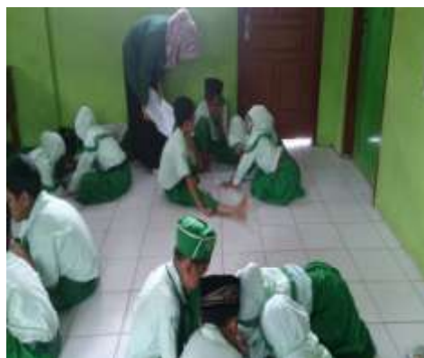
Peneliti membantu jalannya diskusi