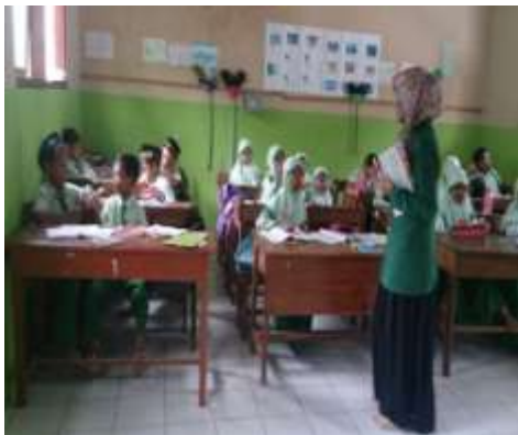
Peneliti menjelaskan materi