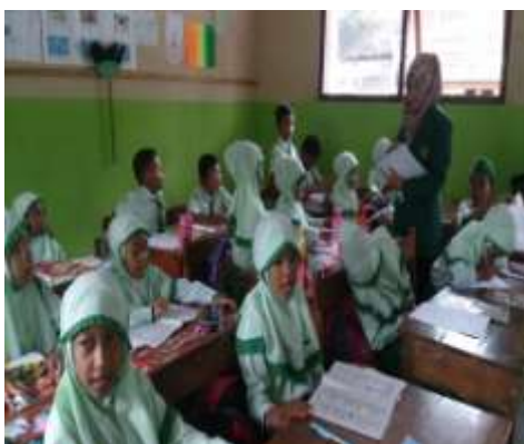
Peneliti membagikan soal Post Test Siklus I