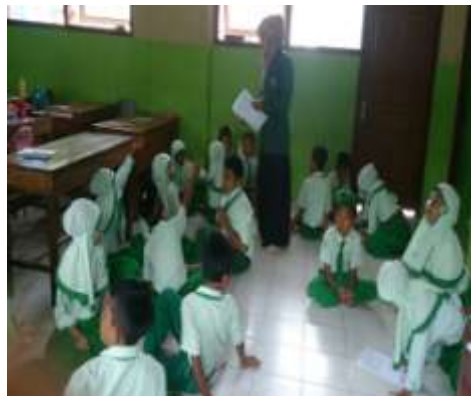
Peneliti membagikan soal kelompok