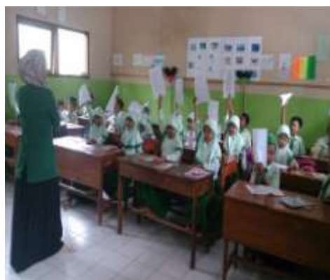
Peneliti menjelaskan petunjuk mengerjakan soal Post Test