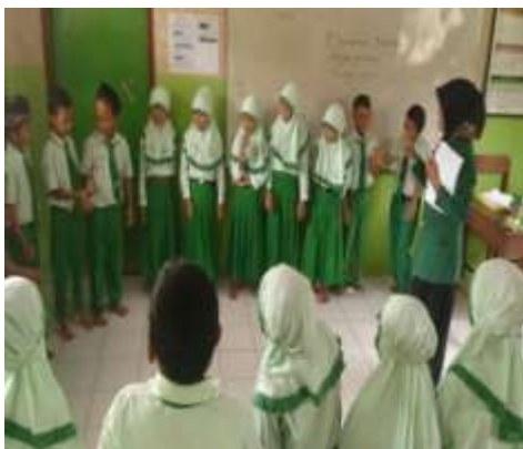
Penerapan metode Taking Stick