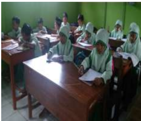
Peserta didik mengerjakan soal Post Test Siklus II