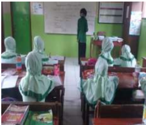
Peneliti menjelaskan materi