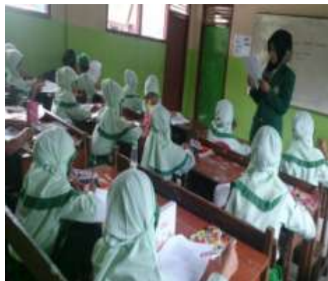
Peneliti membantu menjelaskan soal Post Test Siklus II