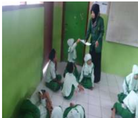
Peneliti membagikan soal kelompok