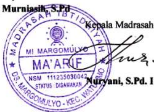
Pipit Ayu Palupi