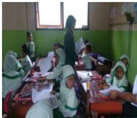
Peneliti membagikan soal Post Test Siklus II