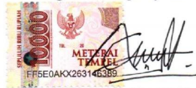
Eke Nur Aini