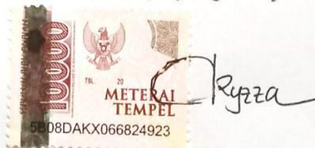
Putri Elfa Nur Izza