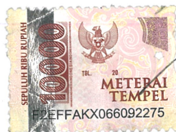
IRMA AULIA SAPUTRI