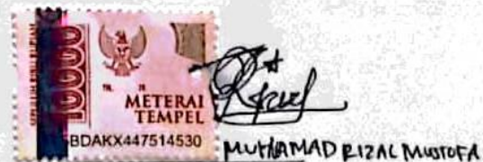
Nama terang dan tanda tangan

Tulungagung, 31 JULI 2023 Yang Menyatakan,