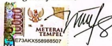
NILTA LATHIFATUL M Nama terang dan tanda tangan

Tulungagung, 6 SEPTEMBER 2023 Yang Menyatakan,