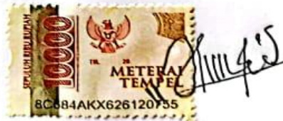
SISKA JAUHARATUL FALAH