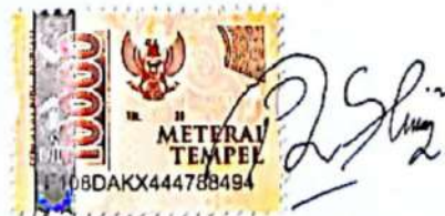
NURMAYA IKA SALSABILA