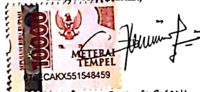
BINTI DWI SURYANI Nama terang dan tanda tangan