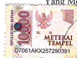
Gilang Dzulkifli Imam