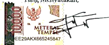
MOHAMMAD ABDUL FATIH SAFUTRA Nama terang dan tanda tangan

Tulungagung, 30 Januari 2024 Yang Menyatakan,