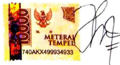
Sekar Ayu Larasati