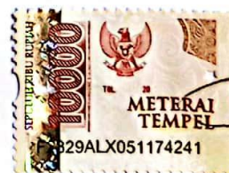
Latif Fatul Fazariyah