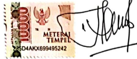
Zulfa labibatul Mufidah