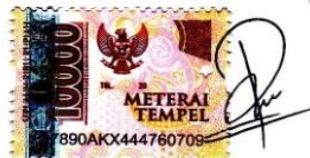
Panggih Trisila Nugraha