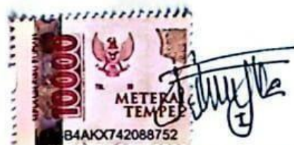
Elvira Devi Anggraini