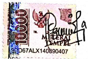
Putri Syifa Fauziyah

Tulungagung, 14 Mei 2024 Yang Menyatakan,