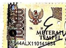
ERLIANI AYU SETYANING SUCI Nama terang dan tanda tangan

Tulungagung, 5 JUNI 2024 Yang Menyatakan,