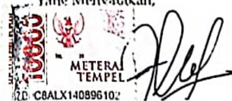
Emarotus Sholeha Nama terang dan tanda tangan

Tulungagung, 6 Juni 2024 Yang Menvatakan,