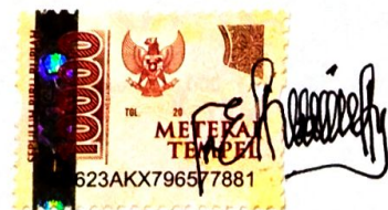
Reza Nur Pebriyanti