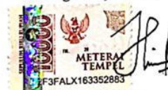
Novriyo Aldilla Afuw Razaq Nama terang dan tanda tangan

Tulungagung, 13 Juni 2024 Yang Menyatakan,