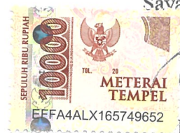
Fifit Iza Rosita