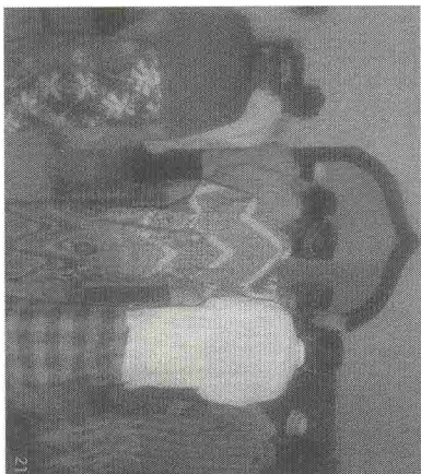
Gb. 3. Salat magrib, setelah diajari praktik salat. 21

Untuk masalah pembimbing selama ini susah sekali mengkondisikan karena memang akses medan berat, membutuhkan waktu dan tenaga yang ekstra, sehingga saya sendiri juga bingung walaupun saya juga bekerja sebagai penyuluh di Besuki namun untuk menggerakkan para penyuluh lain untuk berpartisipasi itu sulit sekali, walaupun mereka semua sudah PNS. Ya itu tadi karena medan berat, waktu dan biaya. Hanya person yang memiliki jiwa dakwah saja yang bersedia meluangkan waktunya untuk ke sana. Saya sendiri ada hal yang menurut saya tidak begitu strong dengan sikap warga Klathak. Selama ini kalau ada orang yang datang ke kampung Klathak, para warga sudah menarget apa yang bisa diberikan untuk kami. Mereka sudah berharap bantuan ini itu dan itu. Pola pemahaman inilah yang sebenarnya harus diubah oleh para penyuluh atau siapa pun yang peduli dengan Klathak, bagaimana cara mengubah mindset mereka supaya kalau ada person yang peduli dengan mereka dalam benak mereka itu bukan semata mengharap bantuan yang sifatnya material. 20