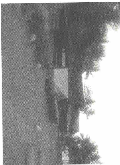
Gb. 1. Suasana pemukiman warga Klathak 6

Sebelumnya warga menjalankan aktivitas dengan tidak jelas tujuan hidup ini mau kemana, mereka tidak memahami Islam secara benar (walau di KTP mereka beragama Islam namun tidak paham sama sekali tentang Islam) dan tidak pernah melaksanakan ibadah karena memang tidak paham dan tidak orang yang mengajari atau menyampaikannya. 5 Jarang orang menyangka kehidupan warga Dusun Klathak yang tenang ini ternyata di dalamnya mereka kering dan haus akan siraman rohani keagamaan. Potret perumahan warga Klathak sebagaimana gambar berikut: