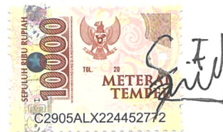
Fima Anindia Fegista