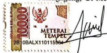
AINUN ALVIANA RAHMAWATI