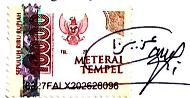
AFI AZIZATUR ROHMAH

Tulungagung, 12 JULI 2024 Yang Menyatakan,